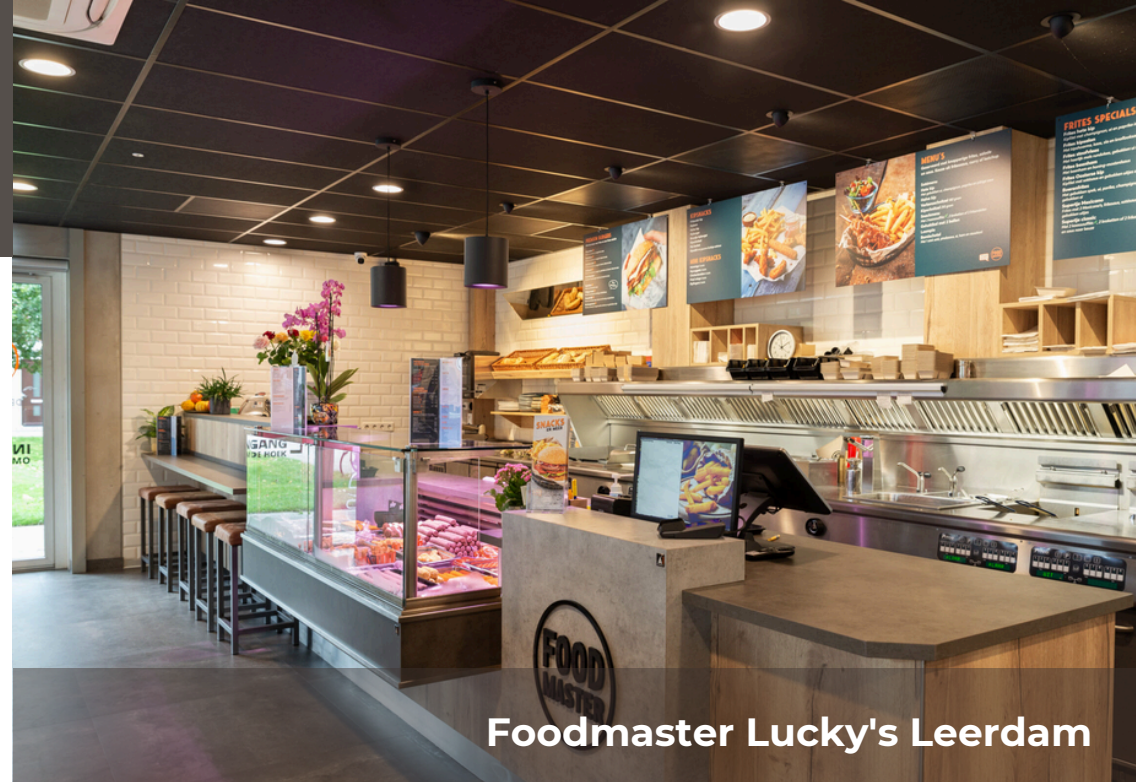
Foodmaster Lucky's Leerdam

Een inrichting waar vorm, functie en gastvrijheid samenkomen.