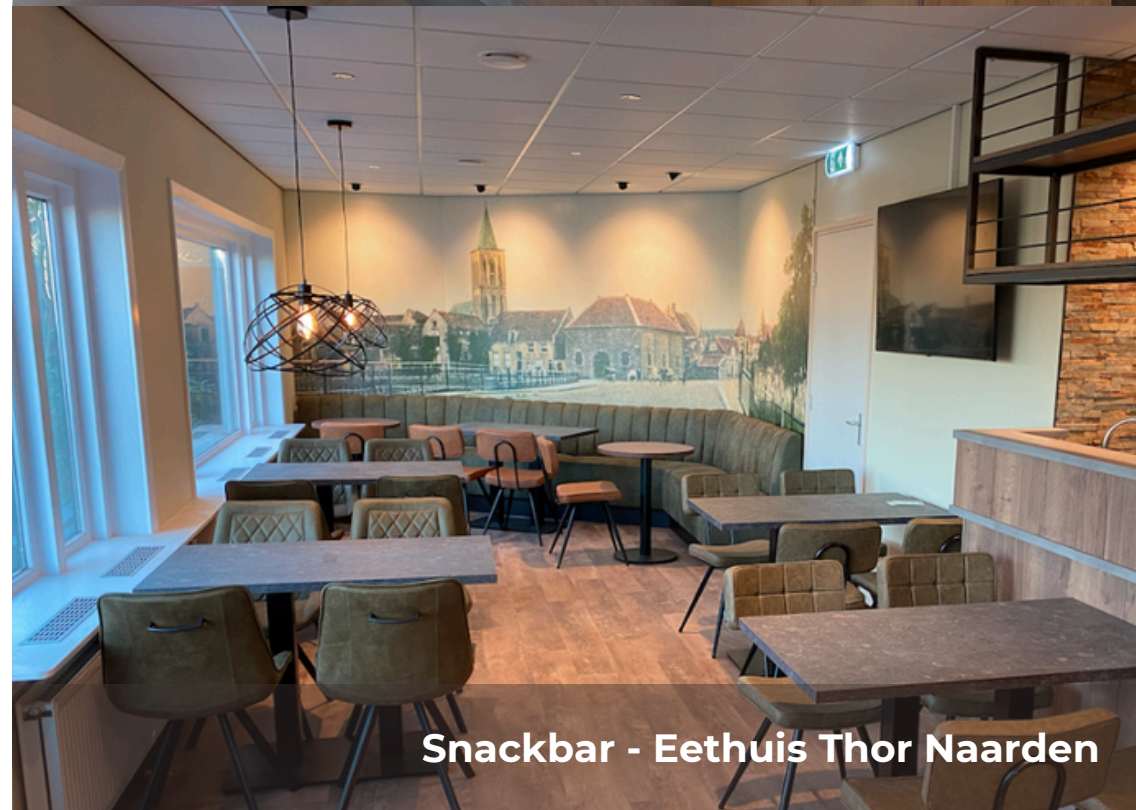
Snackbar - Eethuis Thor Naarden